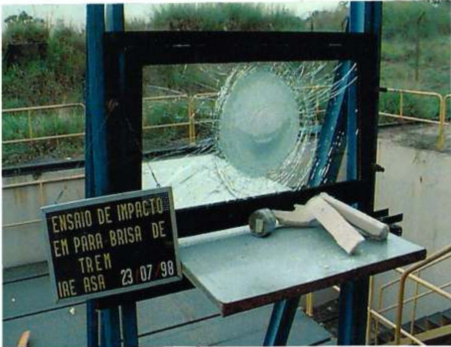
FOTO 4 - VISTA DO CORPO-DE-PROVA APÓS O 2º DISPARO